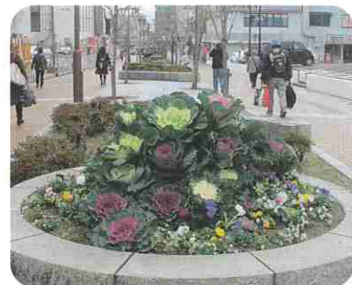
新田辺駅前大通線