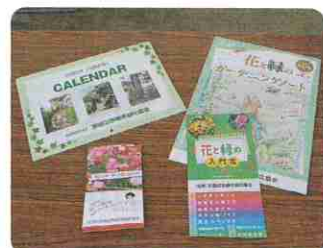
当日配布した冊子・カレンダー・花の種子

当日は好天に恵まれ、朝早くから苗木や花苗が市価より安いとあって大勢の来場者で賑わいました。