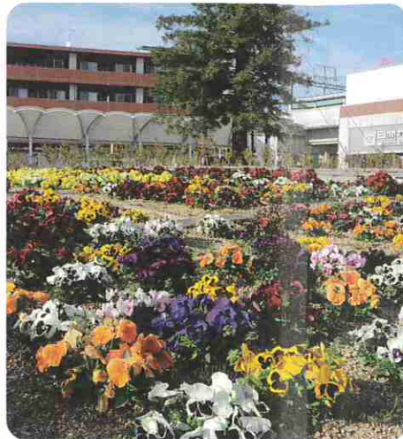
近鉄・JR三山木駅前

花と緑の推進事業として、今年度も希望される市内の各保育所・幼稚園・小中学校及び区・自治会等に花苗や球根を配布し、子供たちや地域の方々による花づくりと緑化を推進しました。